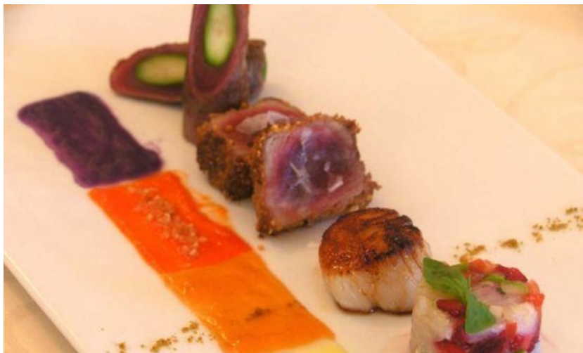
Un fantasioso piatto di Tano passami l'olio